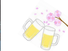
菅野副会長 乾杯挨拶